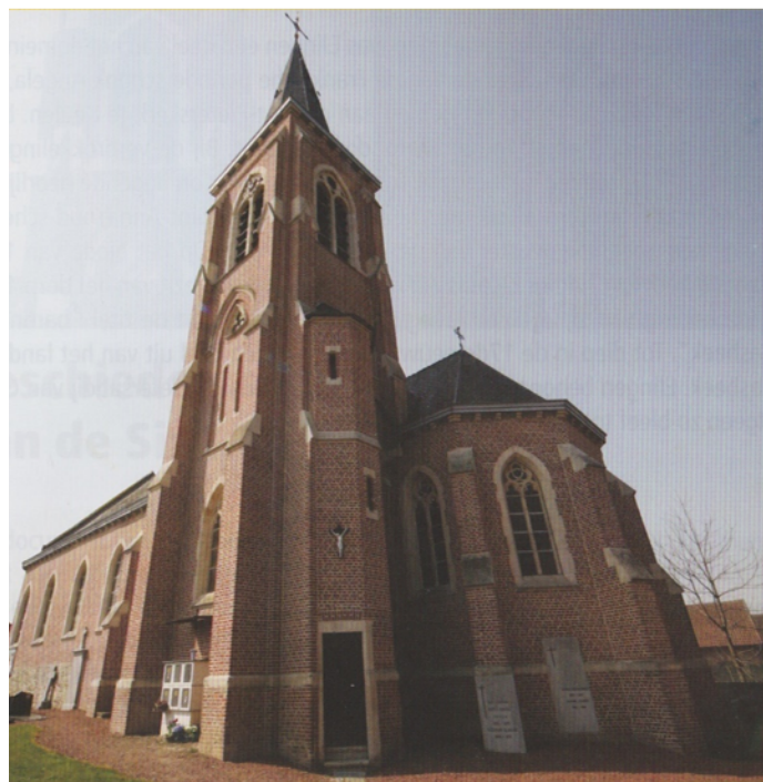
De kerk van Elingen

In de vorige Naklanken mochten we onze muzikanten van 1855 volgen op hun lange tocht naar en van Halle om de nieuwe Pepingse burgervader, Ridder Camberlyn d'Amougies , met de nodige luister naar zijn dorp te begeleiden. Ook een eeuw terug, in de jaren twintig van de vorige eeuw, werd onze fanfare gevraagd om te zorgen voor muzikale animatie naar aanleiding van feestelijke momenten, dit keer op een processiedag te Elingen.